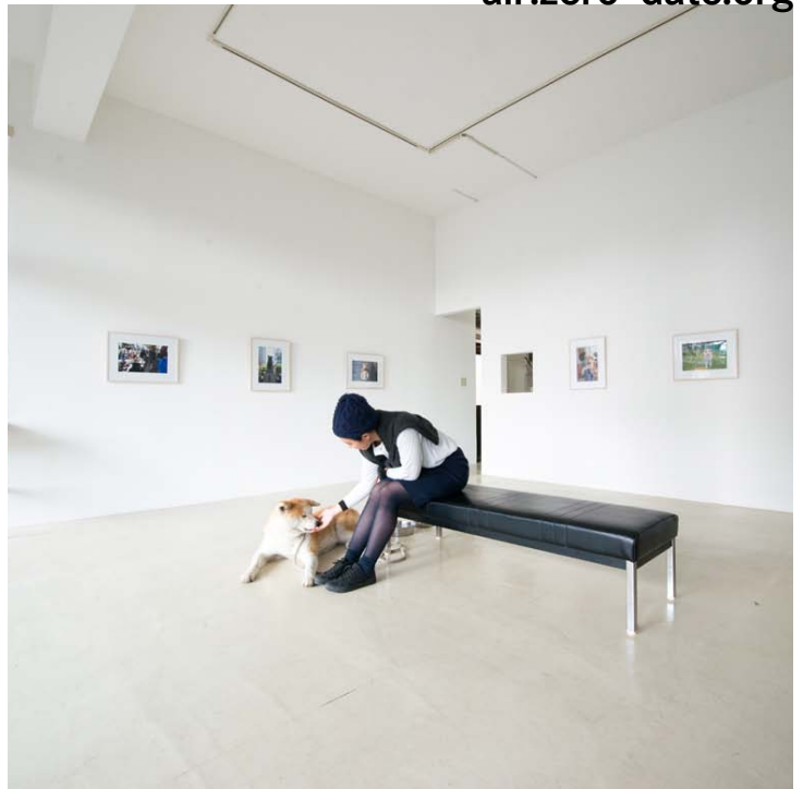
ギャラリースペース (40 m 2 ) / ゼロダテアートセンター

アーティストはもちろん、キュレーター、研究者、学生など、短期滞在も受け付けていますので、お気軽にお問い合わせください。