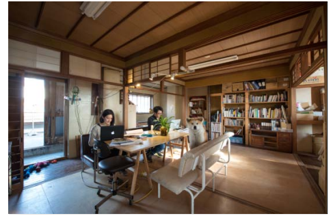
ゼロダテアートセンター 2 階の打ち合せスペース。デスクワークなどでも使用可能