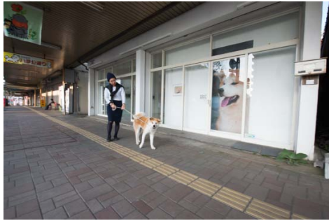
ゼロダテアートセンターの外観。大館市の旧中心市街地大町商店街の空き店舗を利用