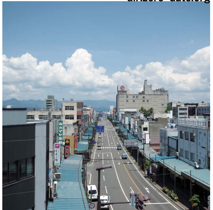
ゼロダテアートセンターが位置する大館市の中心市街地、大町商店街