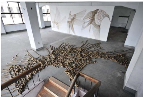
大館食品デパート 3 階のスタジオ B (110m 2 )。オープンスタジオやワークショップなどのイベント利用も可能