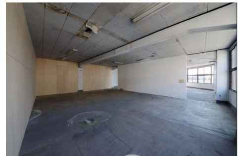
大館食品デパート 3 階のスタジオ C (160m 2 )。3 面の壁面を使用可能