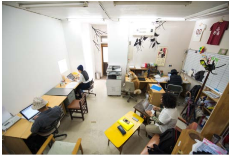
滞在中のアーティストも使用できる事務所スペース。インターネットやレーザープリンターも使用可能