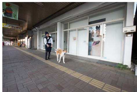
ゼロダテアートセンターの外観。大館市の旧中心市街地大町商店街の空き店舗を利用