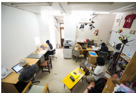
滞在中のアーティストも使用できる事務所スペース。インターネットやレーザープリンターも使用可能