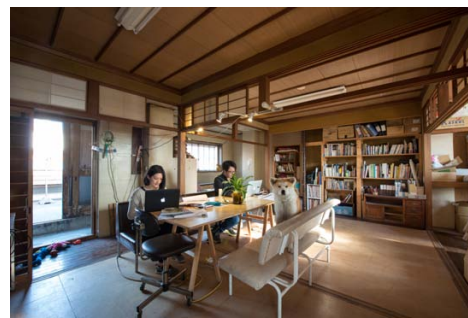
ゼロダテアートセンター 2 階の打ち合せスペース。デスクワークなどでも使用可能